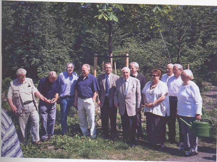
Vertreter Bremer Bürgervereine spenden dem Bürgerpark den „Baum des Jahres“, eine prächtige Rosskastanie

Besonderes Interesse bei den Parkbesuchern und natürlich bei den Kindern findet das Tiergehege. Nicht nur seine zentrale Lage zwischen dem Kaffeehaus und der Meierei sind dafür die Ursache. Es ist vielmehr sein vielseitiges und in Bremen einzigartiges Angebot, mit den unterschiedlichsten Tieren in einen fast direkten Kontakt zu gelangen.